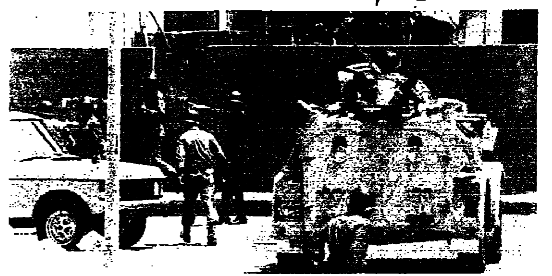
توزيع للقوات أثناء عملية الانتماء امس

قامت « الفرقة القتالية » التي الحقت بـ « الفرقة ١٦ » في بيروت بارول عملية اقتحام امس ، استهدفت القوى على أشخاص أطلقوا النار على حاجز للشرطة في محلة الكرتينا واصابوا شريفا بجروح . وقد اشتركت بمهمة عدفيصحات وصودرت فيها مجموعة اسلحة قذائف وتم توقيف ستة أشخاص . ( التفاصيل على الصفحة ٤ )